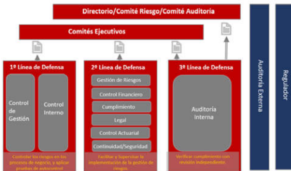
Tres Líneas de defensa

La estructura adoptada para reflejar, esquematizar desde una mirada global y de alto nivel, las responsabilidades y funciones de cada Área y/o Gerencia frente a la Administración de Riesgos de la Compañía es el “Diagrama de las Tres Líneas de Defensa”, que a continuación se indica: